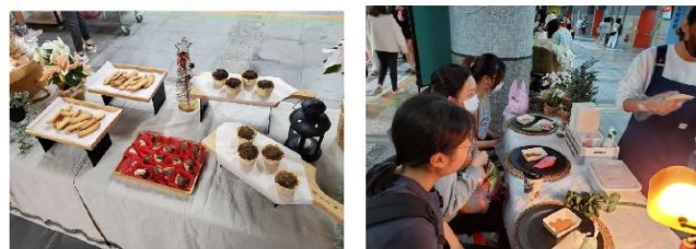
自主募課—材料費明細與照片